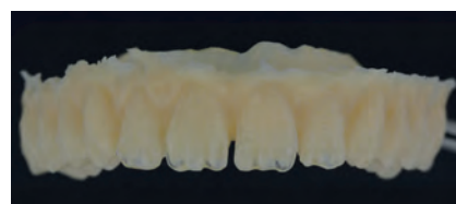
top.lign professional «топ.лайн профессионал» в необработанном виде