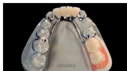
Протез на модели