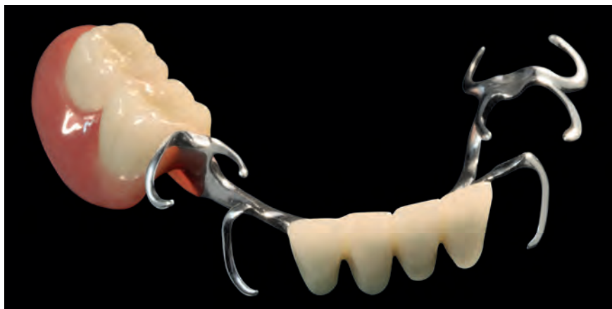
Кламмерный протез из top.lign professional «топ.лайн профессионал» и облицовочных оболочек novo.lign «новолайн»