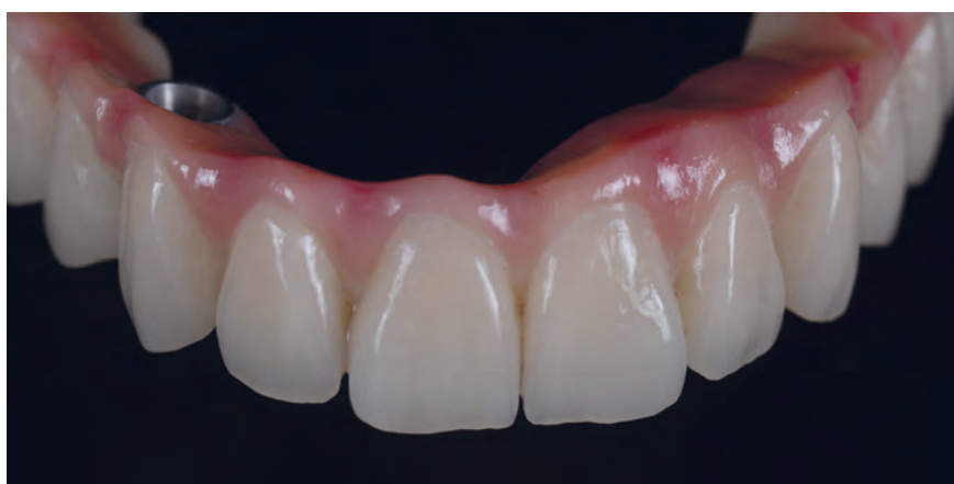
Мост из top.lign professional «топ.лайн профессионал» и обработанной десны, индивидуализирован с помощью crea.lign «креа.лайн»