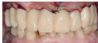
Протез в полости рта пациента