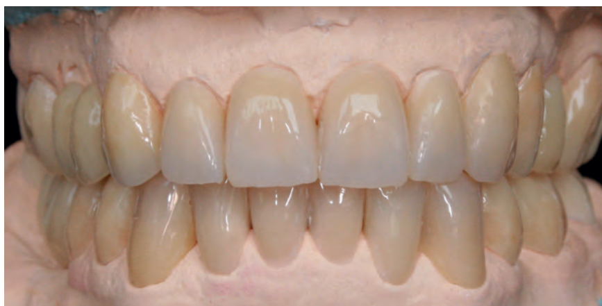
Мост из top.lign professional «топ.лайн профессионал»