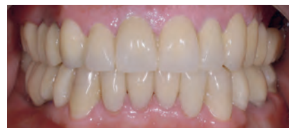
Протез в полости рта пациента