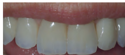
Протез в полости рта пациента