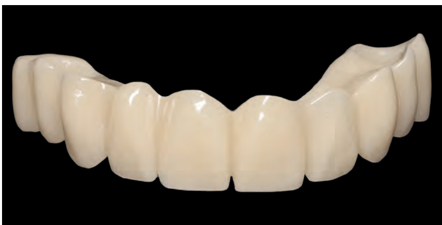
Подлежащий немедленной нагрузке мост, монолитно изготовленный из top.lign professional «топ.лайн профессионал»